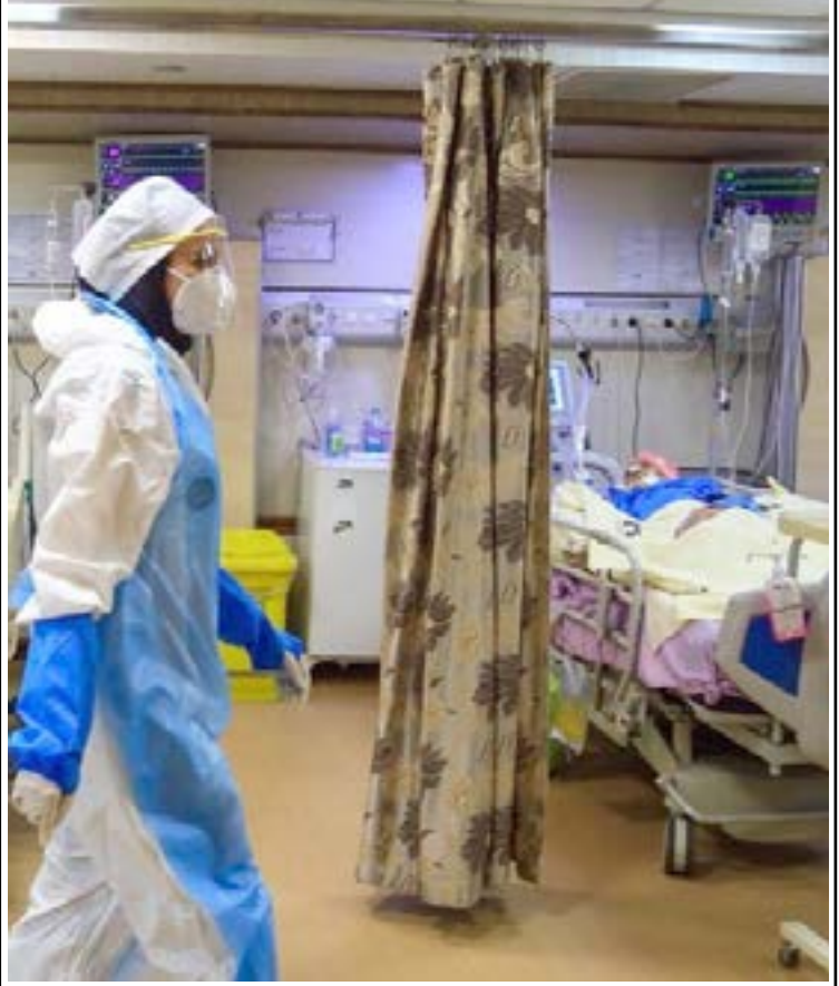
مدیر پرستاری دانشگاه علوم پزشکی گیلان:

بخش زیادی از معترضین اعلام کردند با وجود اینکه درآمد ثابت ندارند و یارانه معیشتی را هم دریافت می کنند، اما کمک ۱۰۰ هزار تومانی به حسابشان واریز نشده است. البته با توجه به شروط دیگر، تمام ۶۰ میلیون نفری که یارانه معیشتی بگیر بودند این ۱۰۰ هزار تومان را دریافت نخواهند کرد چون ممکن است حقوق ماهیانه بگیرند یا بیمه پرداز باشند. گروه دیگری اعلام کردند که وام یک میلیون تومانی را دریافت