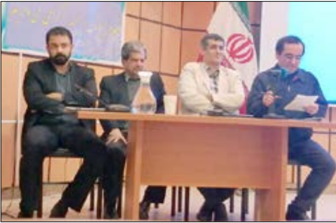
اعضای هیئت مدیره شرکت لامپ سازی رشت

ماهی است که توسط سازمان جنگل‌ها به مدت ۱۰ سال در جنگل‌های شمال کشور تنفس اعلام شده است و خوشبختانه پیمانکاران یا تعاونی‌های چوب و جنگل با فرض اینکه نظارت خوبی از سوی این سازمان یا ادارات منابع طبیعی صورت گیرد و دست قاچاقچیان چوب از جنگل‌های گیلان و مازندران قطع شود می‌توان امیدوار بود آنچه که در محوطه شرکت لامپ‌سازی گیلان اتفاق افتاده است و طبیعت و درختان از دل بتن و سیمان خودشان را احیاء کرده‌اند در نتیجه نظارت متولیان سازمان جنگل‌ها درختان تخریب و قطع شده جنگل‌های گیلان و مازندران نیز زنده و پویا شده تا نسل‌های آینده هم بتوانند از اکسیژن حاصل از درختان جنگلی بهره‌مند شوند.