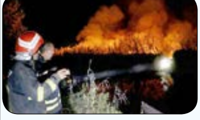
آتش به جان تالاب انزلی ۱۰ هکتار از نیزارها سوخت