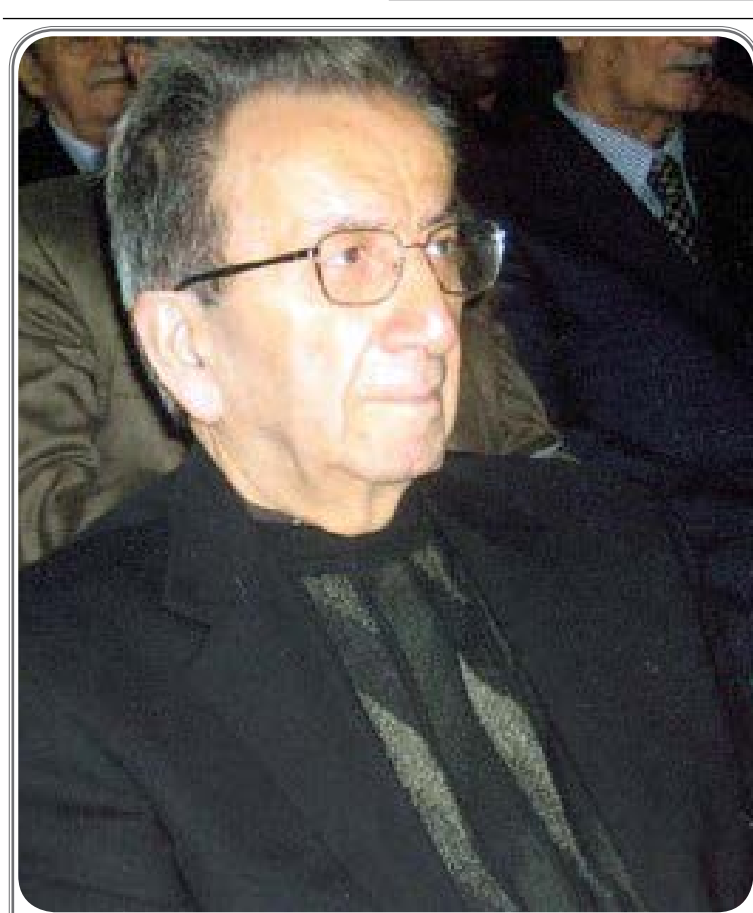
دکتر محمد علی فائق پزشک و روزنامه نگار پیشکسوت گیلانی در گذشت

شهردار رشت: با اولین سرمایه گذاری بخش خصوصی قطار توسعه رشت حرکت می کند