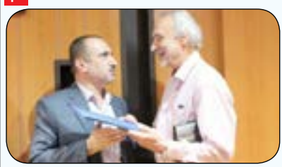
برگزاری نشست نقد و بررسی عملکرد وزیران اعظم دوره ی صفویه در سازمان اسناد و مدیریت استان گیلان