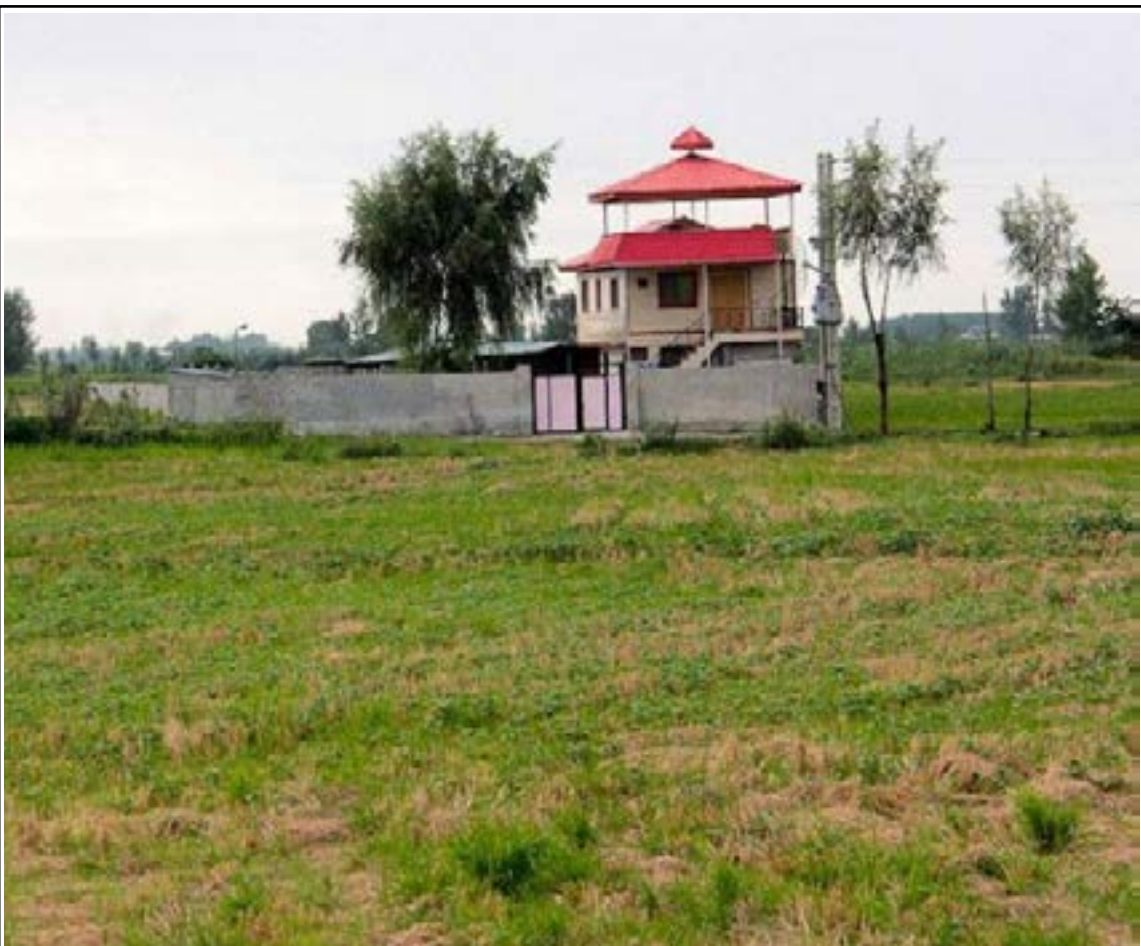
سایه تهدید بر میراث طبیعی گیلان