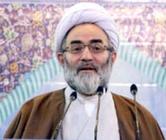
امام جمعه رشت:

برخی دستگاه های اجرایی به خانه سالمندان تبدیل شده است