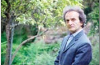
شهرداد روحانی در جشنواره بین‌المللی نمایش عروسکی تهران